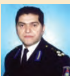
Του Ανδριανού Γκουρμπάτση Αντιστρατήγου - Υπαρχηγού Π.Σ. ε.α. - Νομικού