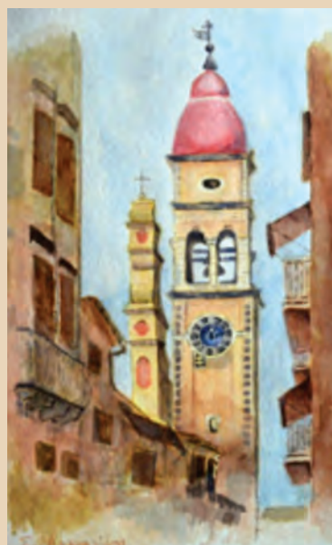
Το καντούνι του Αγίου Σπυρίδωνος

Ενδεικτικά παρουσιάζουμε ένα δείγμα από τα έργα του, που ανιχνεύσαμε στο διαδίκτυο.