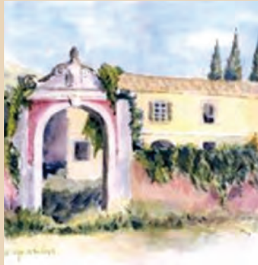
Αρχοντικό στη Βόρεια Κέρκυρα

πων της καθημερινής ζωής. Σε ένα περιβάλλον όπου το παρελθόν και το παρόν συναντώνται